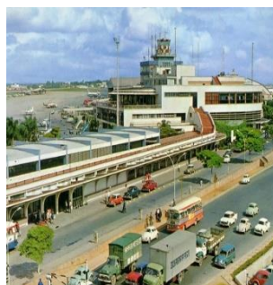
Congonhas Sao Paulo