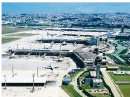
Guarulhos International Airport Sao Paulo